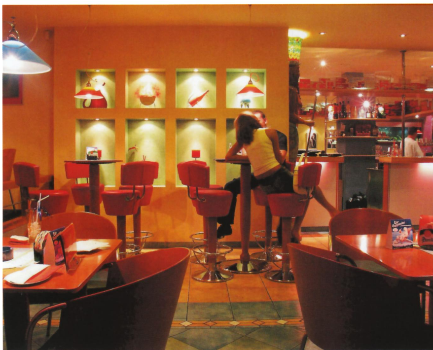
Red caffe restaurant