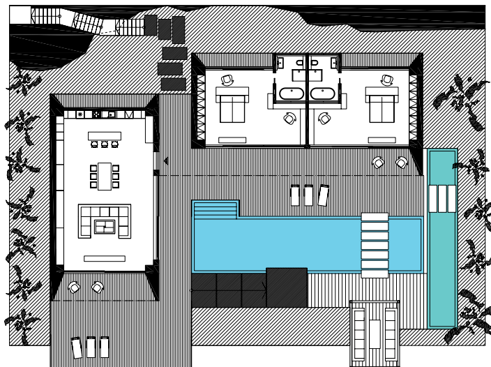
Pôdorysy dispozícií vil